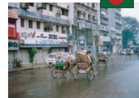
客を乗せて走る サイクルリキシャ (バングラディシュ)