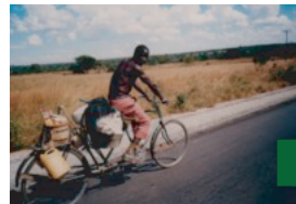
自転車に魚を積んで 行商するおじさん（ザンビア）