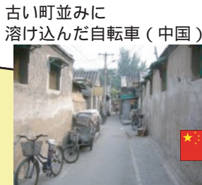
古い町並みに 溶け込んだ自転車（中国）