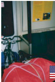
自転車をもそのまま載せられる 地下鉄（アメリカ）