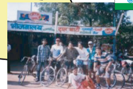
自転車チームの 兄ちゃんたち（インド）