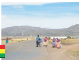
自転車を押して歩く田舎の人々（ボリビア）