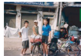
アルジェリア人のチャリダー (パキスタンからインドまで共に走る)