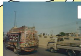
屋根に自転車でも何でも載せられる バス（パキスタン）