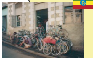
武骨な中古車が 並ぶ自転車屋 (エチオピア)