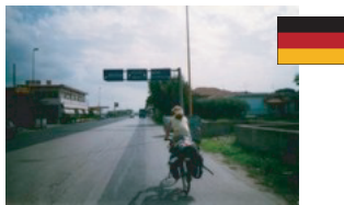
ドイツ人のチャリダー (イタリアを共に走る)