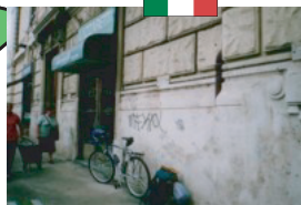
お洒落なスポーツ車が揃う 自転車屋（イタリア）